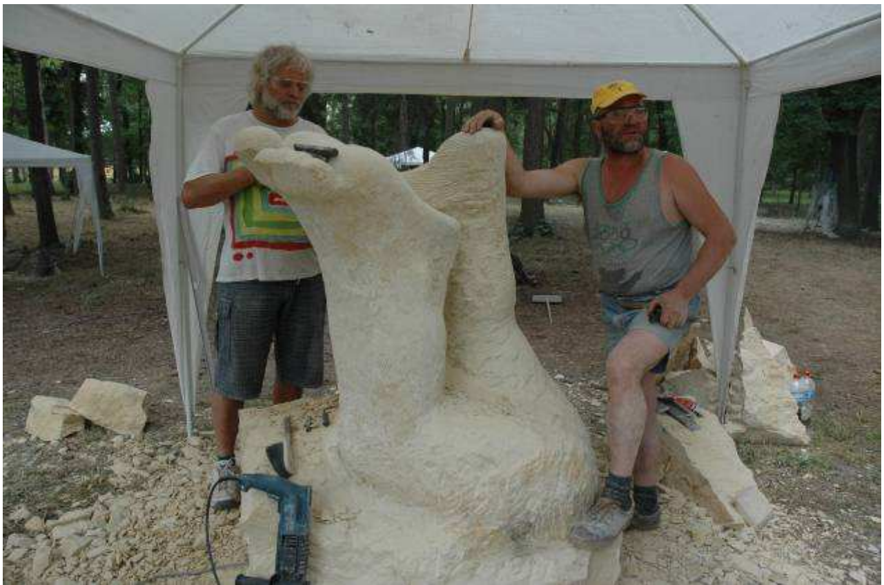
Sochařské sympózium – Františkovy Lázně