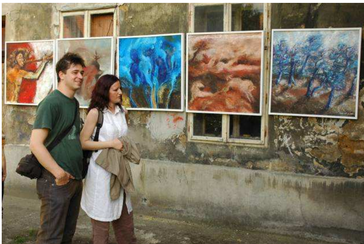
Chebské dvorky - módní přehlídka - vystava obrazů