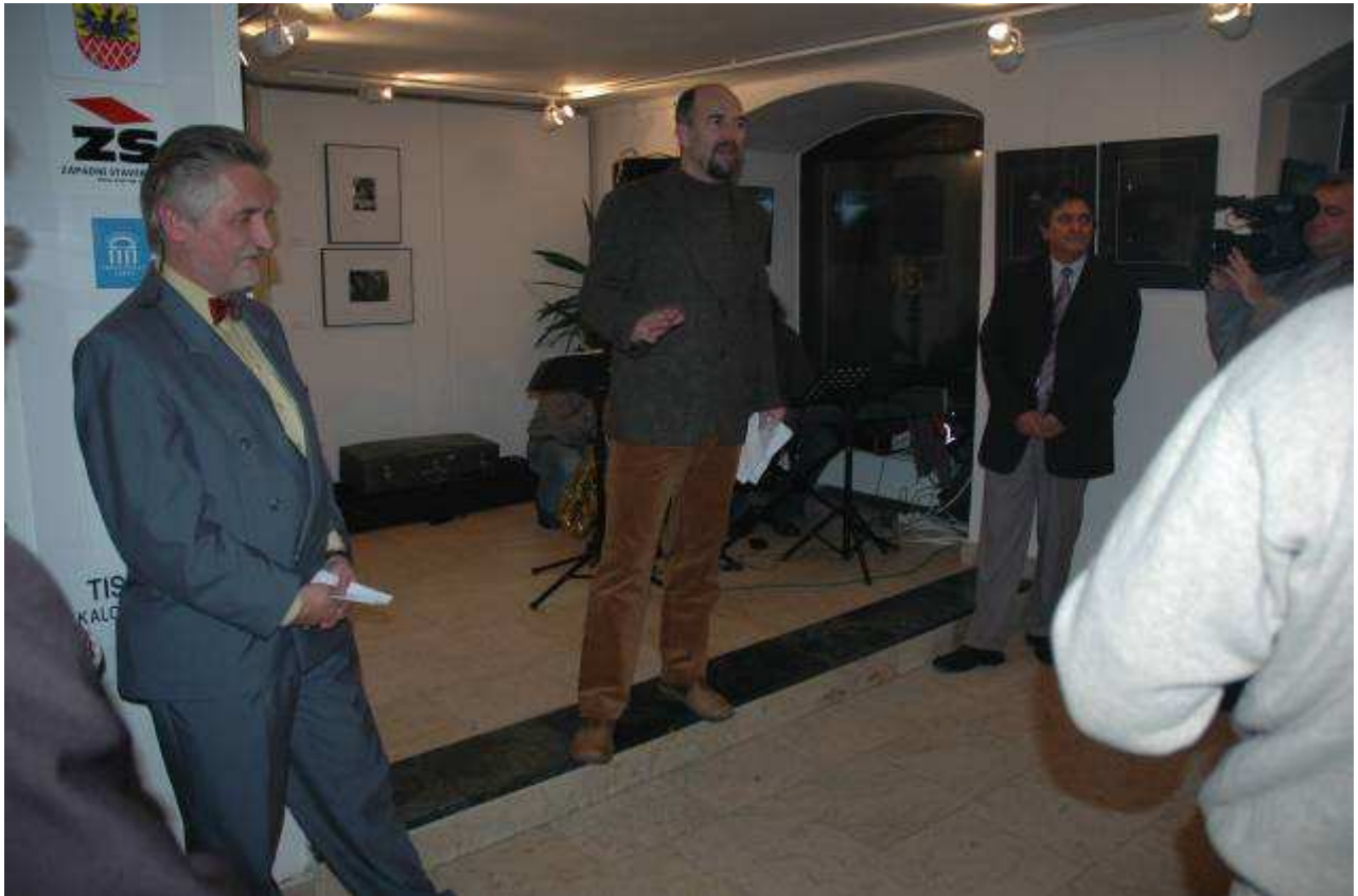
20. výročí založení Galerie 4