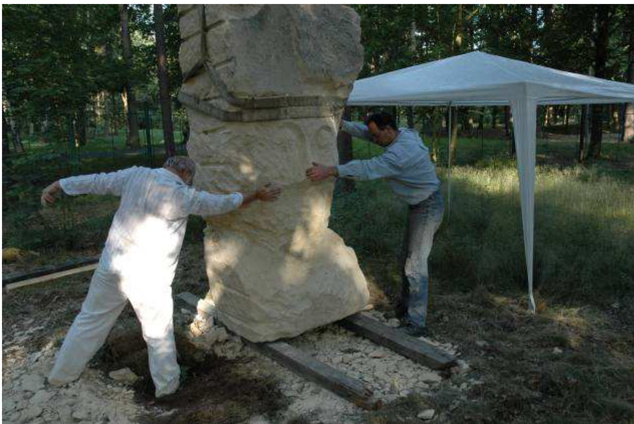
Sochařské sympózium – Františkovy Lázně