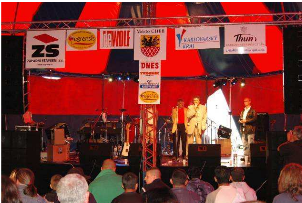
Chebské dvorky – slavnostní zahájení