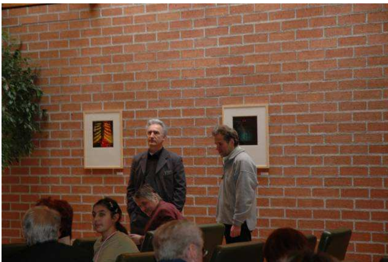
Výstava fotografií Jana Pohribného a Kamila Vargy – radnice Hof