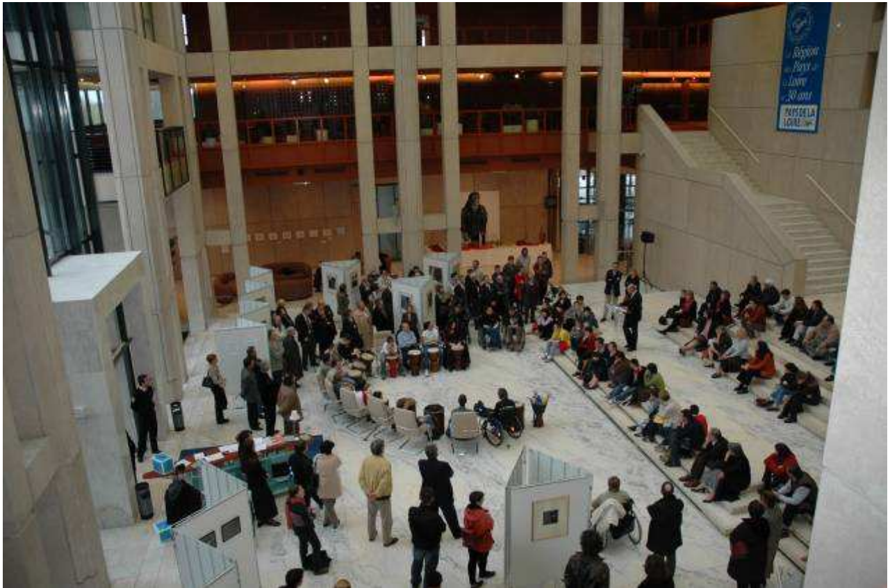
Výstava 50 fotografií – Hôtel de Région, Nantes