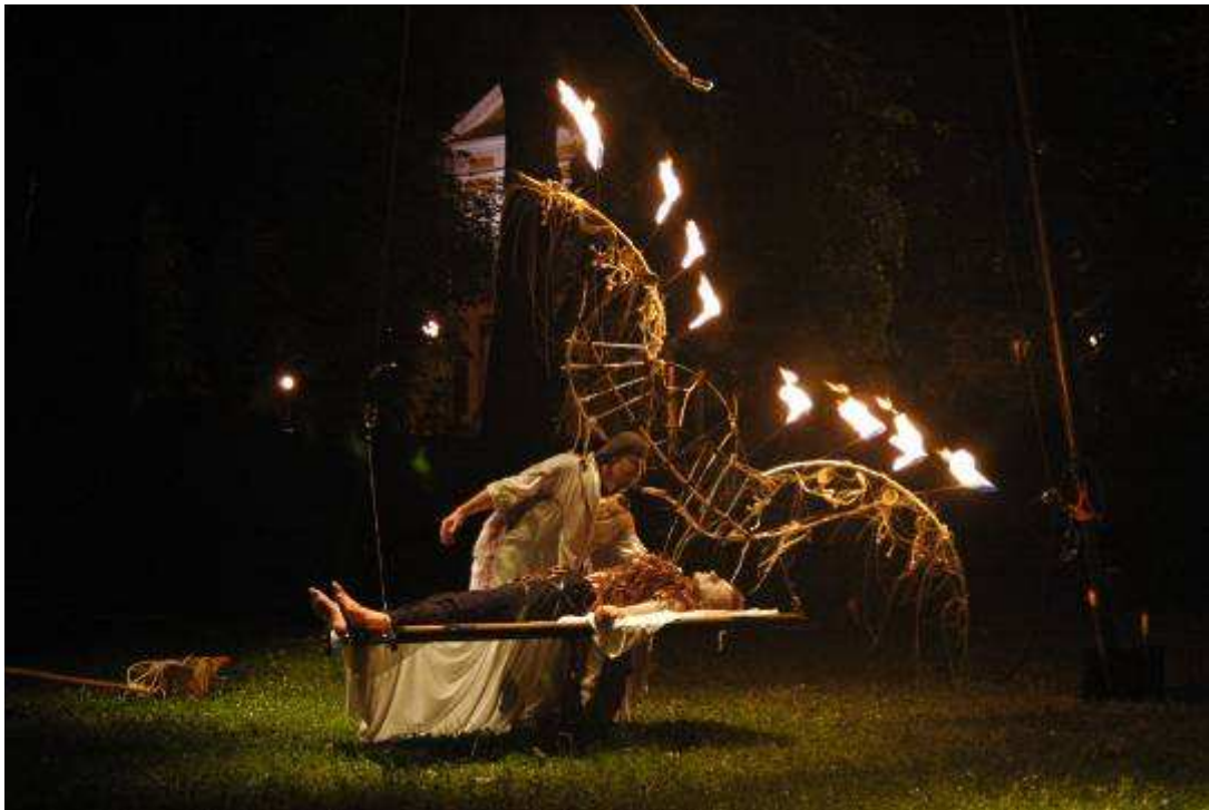
Chebské dvorky – Divadlo Continuo