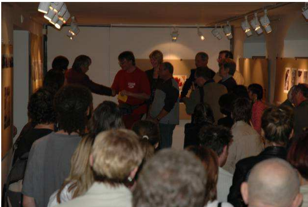
Muzejní a galerijní noc