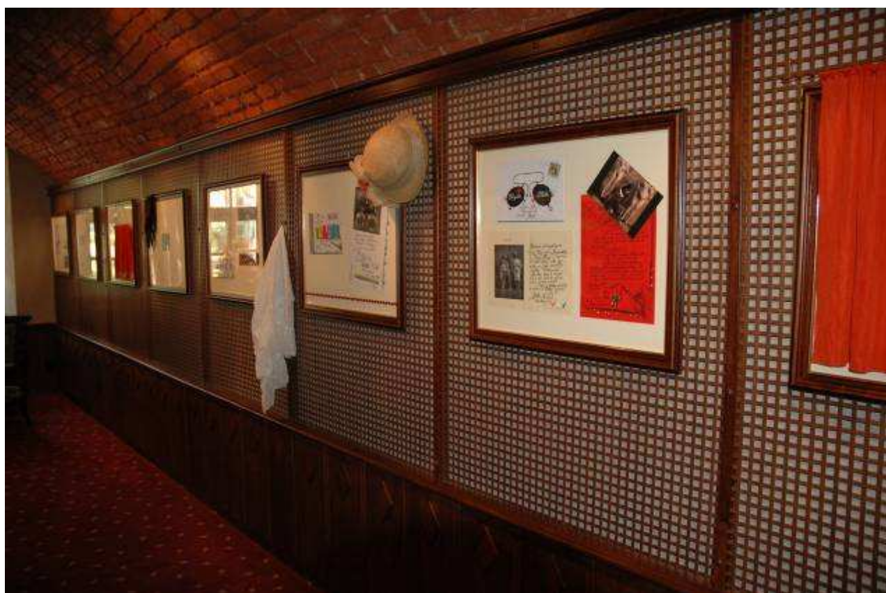
Z útržků – výstava korespondence a fotografií Jana Saudka