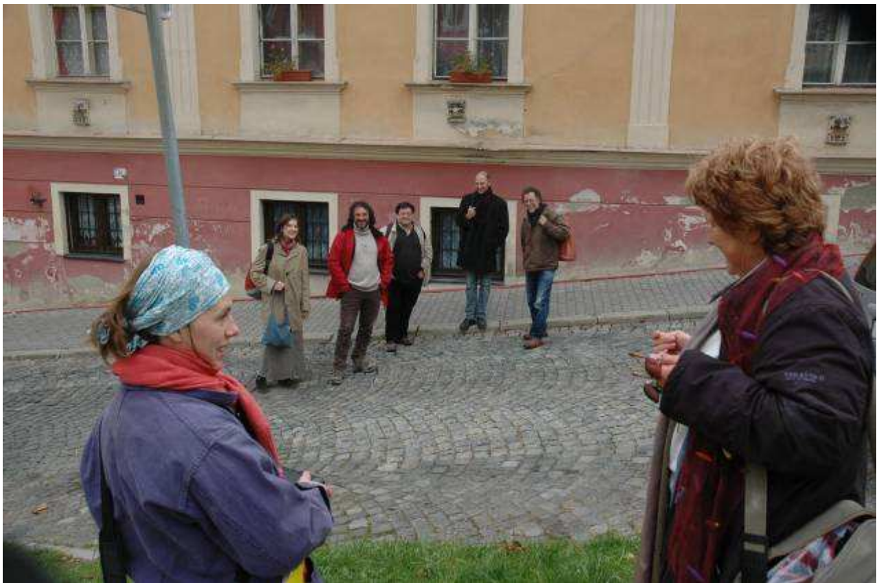
Z jednoho břehu na druhý – česko-francouzský projekt