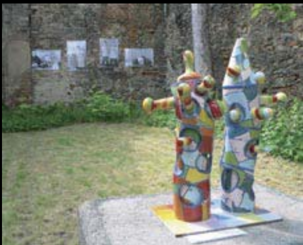
Chebské dvorky, z instalace na popravišti

Workshop pro děti a rodiče se zaměřením na různé výtvarné techniky malby na hedvábí. Workshop vedli dva lektori z občanského sdružení Ateliér, zúčastnilo se cca. 150 účastníků.