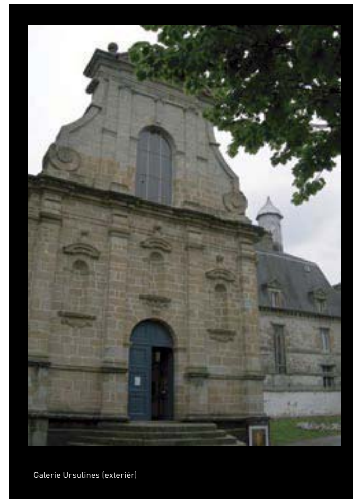
Galerie Ursulines (exteriér)