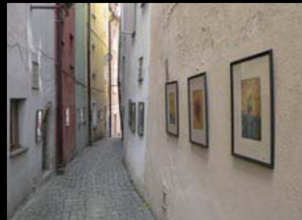
Chebské dvorky, Kramářská ulička

Pro V. ročník festivalu připravuje organizační tým změny, které by měly vést k ještě většímu zapojení návštěvníků do jednotlivých akcí.