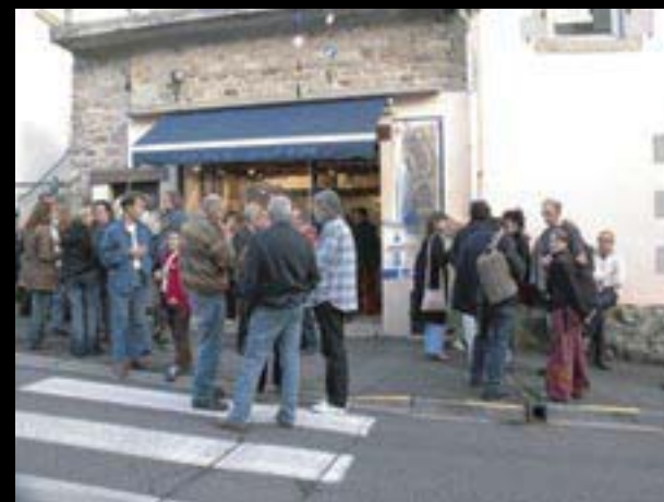
Z jednoho břehu na druhý, čeští a francouzští fotografové v Pont – Aven