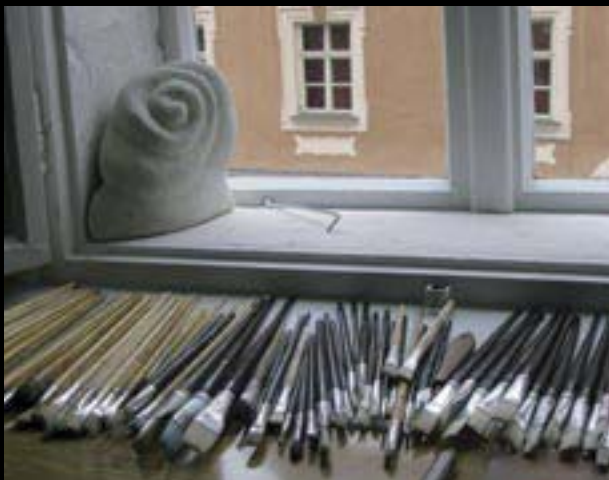
Autor: J. Černý

Finanční úřad Cheb provedl kontrolu dotací Ministerstva kultury České republiky pro Galerii 4 za rok 2002 a 2003. V roce 2002, obdržela galerie dotaci ve výši 150.000 Kč a v roce 2003 250.000 Kč. Obě dotace byly poskytnuty na podporu celoročního výstavního programu galerie. Byly zkontrolovány veškeré doklady týkající se těchto dotací. Kontrola konstatovala, že nebyla porušena rozpočtová kázeň. Kontrola proběhla bez závad.