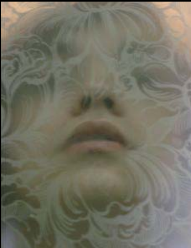
Portrét, Kontaktfoto 2006