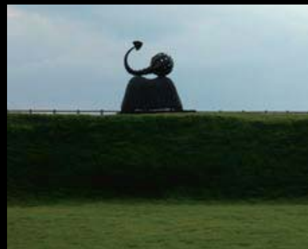
Jaroslav Róna – Sépie na Chebském hradě