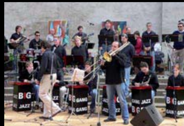
Chebské dvorky, Jazz Big Gang v klášterní zahradě