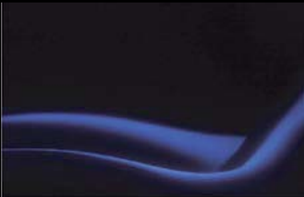
Akt, Kontaktfoto 2006 – autor: L. Stibůrek