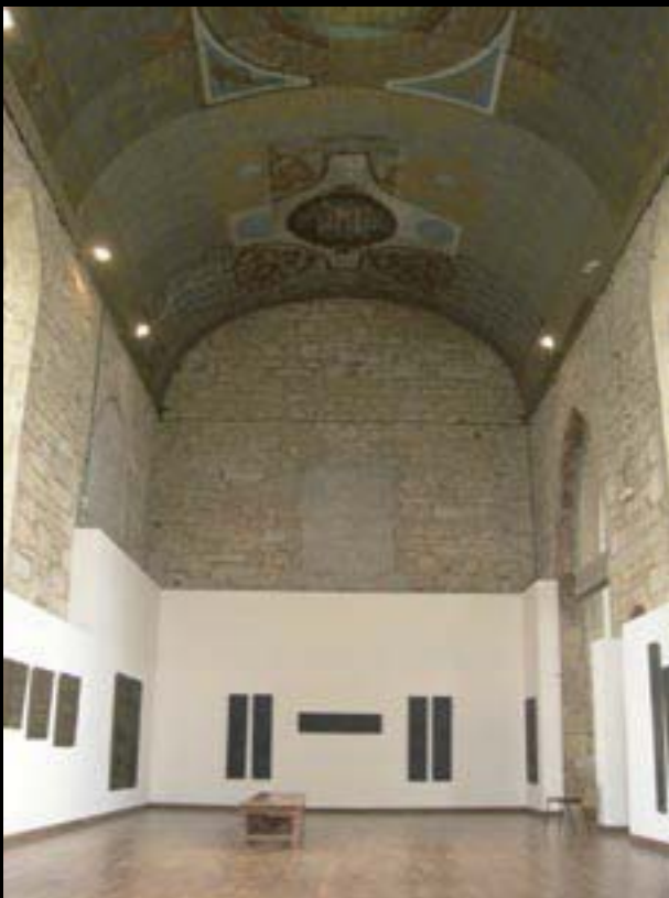
Galerie Ursulines (interiér)