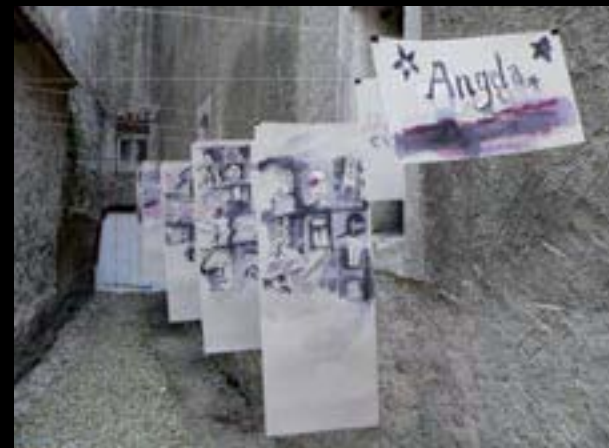
Chebské dvorky, Dopis Angele (instalace)

Všechny úkoly pro příspěvkovou organizaci jsou zadávány na pravidelných poradách ředitelů příspěvkových organizací, které se konají každé 2 měsíce. Úkoly zadané příspěvkové organizaci Galerii 4 z porad ředitelů nebo z usnesení Rady Karlovarského kraje jsou plněny v daných termínech.