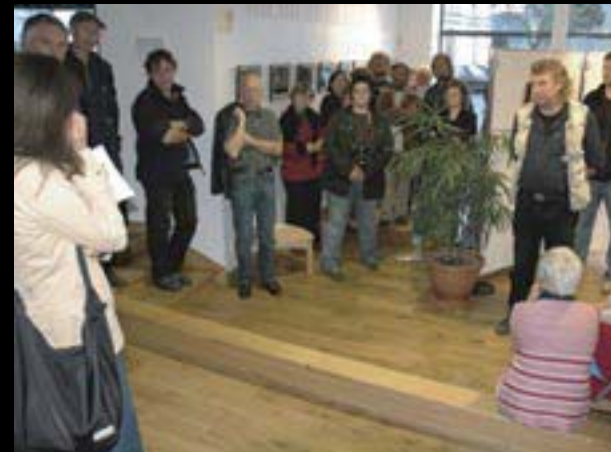
Z jednoho břehu na druhý, vernisáž v galerii Mediatheke, Quimperle, Francie

Galerie 4 představila na tomto festivalu fotografie kolekci z výsledků workshopů Kontaktfoto 2004 a 2005. Na festivalu proběhlo 49 výstav jednotlivců i kolektivů z Evropy i zámoří. Do budoucnosti se uvažuje se spolupořadatelstvím Galerie 4 při pořádání tohoto festivalu.