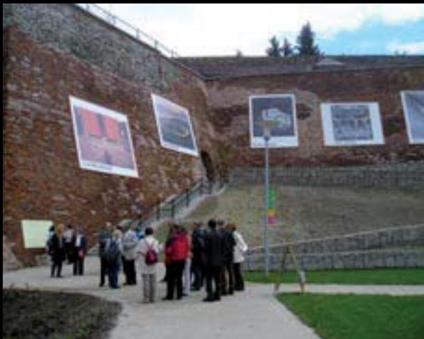
Česká fotografie, instalace na hradbách