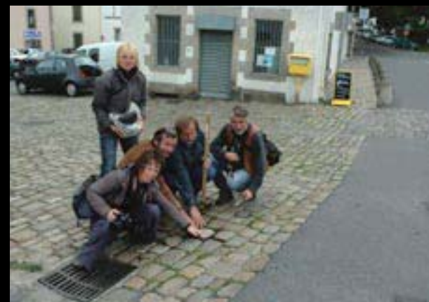
Z jednoho břehu na druhý, akce výměna dlažební kostky Cheb – Quimperle