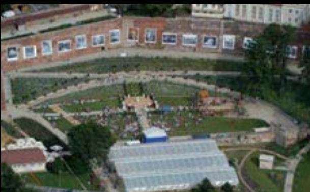
Česká fotografie, instalace na hradbách