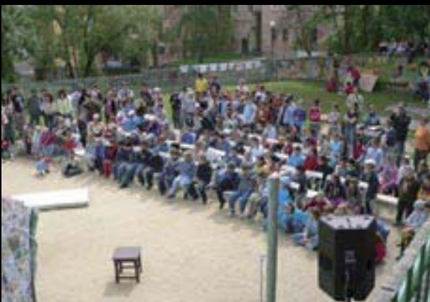
Chebšské dvorky, divadlo pro děti