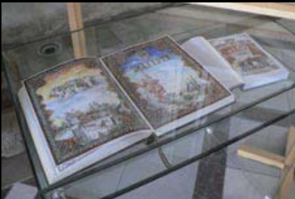
Chebské dvorky, Jindřich Turek – městská kronika