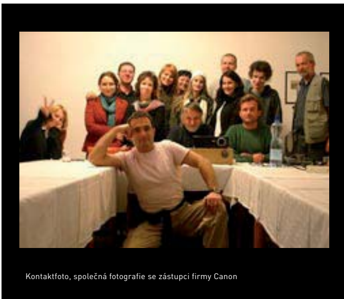
Kontaktfoto, společná fotografie se zástupci firmy Canon