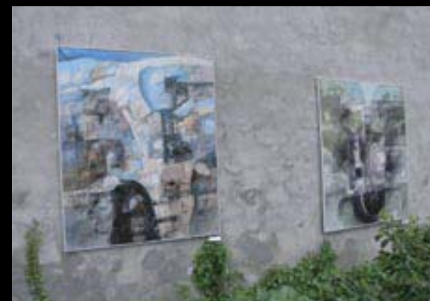
Chebské dvorky, z instalace v Klášterní zahradě