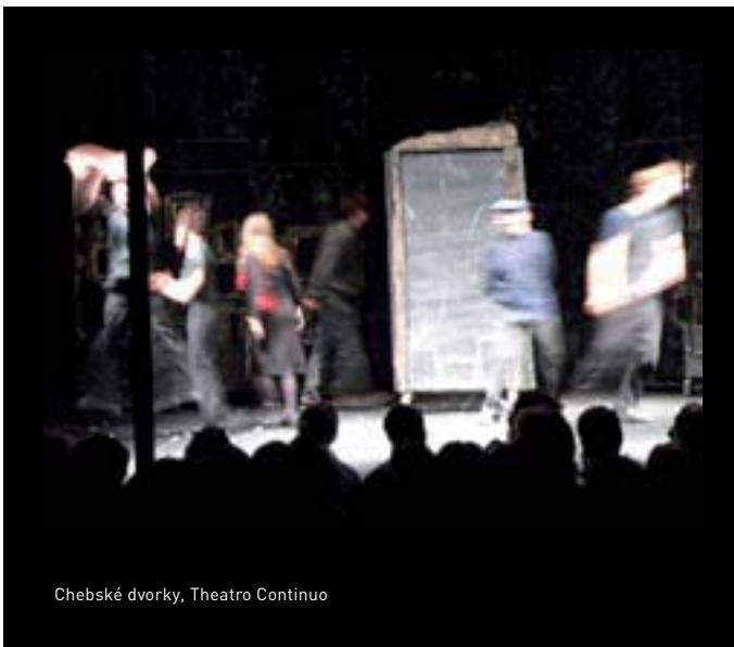
Chebské dvorky, Teatro Continuo

Fondy se začaly zpracovávat v programu Demus. Tento program pro potřeby ukládání exponátů v celku vyhovuje, problémem zůstává nesnadné vkládání obrazové dokumentace exponátů. Koncem roku 2006 se podařilo zajistit cenově dostupné krabice pro archivaci a obálky pro ukládání fotografií. Práce na budování sbírkových fondů pokračují.