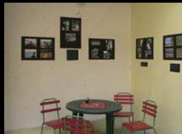
Chebské dvorky, výstava Správy utečeneckých zařízení při Ministerstvu vnitra