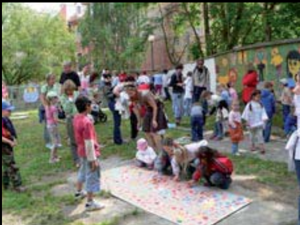
Chebské dvorky, Květiny pro město, dětský výtvarný workshop