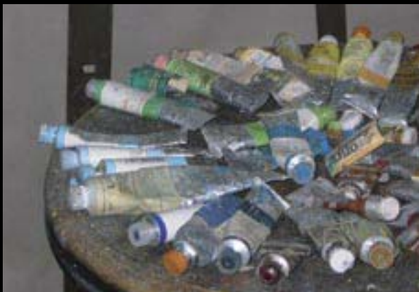
Autor: J. Černý