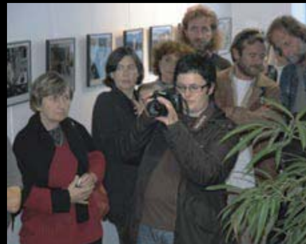
Z jednoho běhu na druhý, vernisáž v galerii Mediatheke, Quimperle, Francie

V zahraničí je Galerie 4 prezentována jako člen Bavorského sdružení deseti galerií. V těchto galeriích je možné se seznámit s programem galerie i dalšími jejími akcemi. Ve Francii je galerie prezentována v umělecké asociaci La Veduta, v Anglii v Side Gallery v New Castlu.