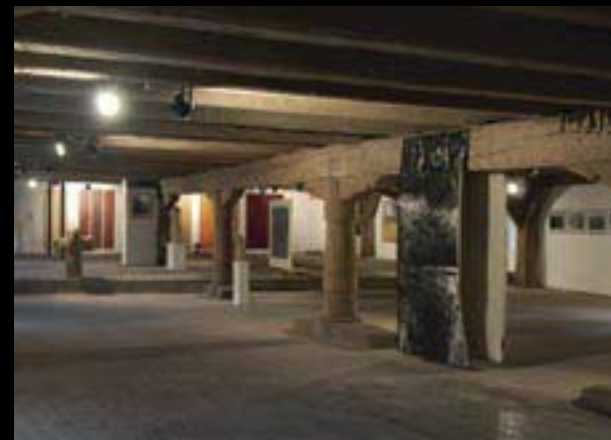
Paměť krajiny – krajina paměti, záběr z instalace ve Špejcharu

Výstava k životnímu jubileu autora oceněného státním vyznamenáním uděleným prezidentem republiky Václavem Klausem za celoživotní dílo.