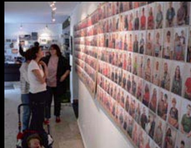
Chebšké dvorky, portréty návštěvníků v Galerii 4

Divočina – Erwin Stäheli (Švýcarsko) (2. 6.–2. 7.) Výstava imaginativních krajin Švýcarského fotografa se silným ekologickým nábojem.