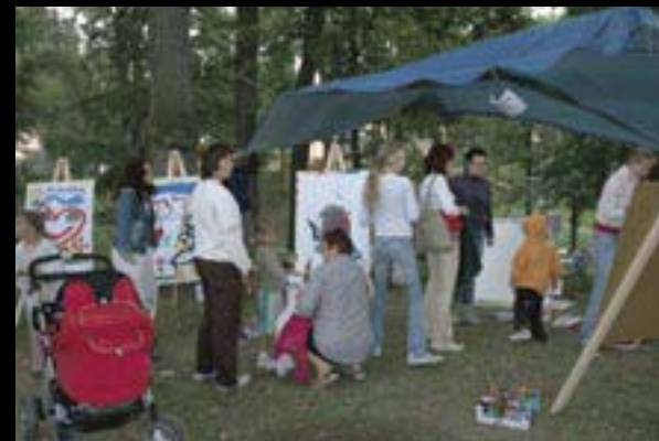
Dětský výtvarný workshop

Dílen se zúčastnilo téměř 2000 dětí, a tento projekt byl veřejností velmi pozitivně přijímán, proto se pro příští rok připravuje obdobný dětský workshop.