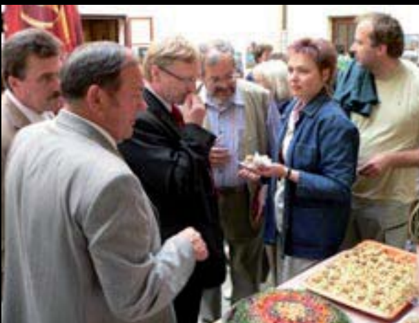
Chebské dvorky, ochutnávka jídel, Správa utečeneckých zařízení Ministerstva vnitra