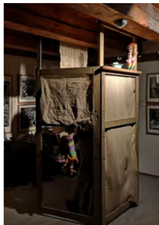
40 LET G4, Buchty a loutky