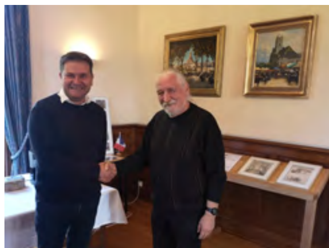
Setkání se starostou města Quimperle během workshopu v Bretani

Galerie 4 se angažuje v mezinárodních projektech a spolupracuje s různými zahraničními institucemi a umělci. Jedním z klíčových pilířů jejich aktivit je dlouhodobá spolupráce s francouzskou asociací La Veduta, která trvá více než 25 let a zahrnuje výměnné výstavy a workshopy fotografů z Česka a Francie. Na podzim se uskutečnil fotografický workshop který bude završen výstavou v roce 2026 v Galerii 4. Vznikly nové aktivity s německou stranou při Neuer Kunstverein Regensburg a K. v. Hof. Uskutečnila se tak v Klubu G4 výstava německých fotografů s názvem REGENSBURG KONVEX. Na rok 2026 je plánována repríza výstavy s názvem V Chebu, z workshopu dokumentární fotografie v německém Hofu a Regensburgu. Frankische Lichtmaler Fotoclub při Kunstverein Hof se představí příští rok výstavou s názvem „In der Stadt“ v Klubu G4.