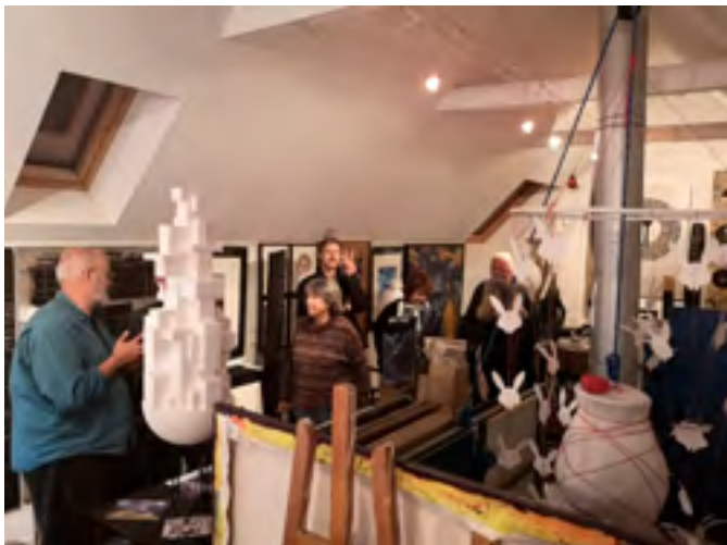
Návštěvy ateliérů v Bretani, z workshopu Bretaň-Breizh 2025