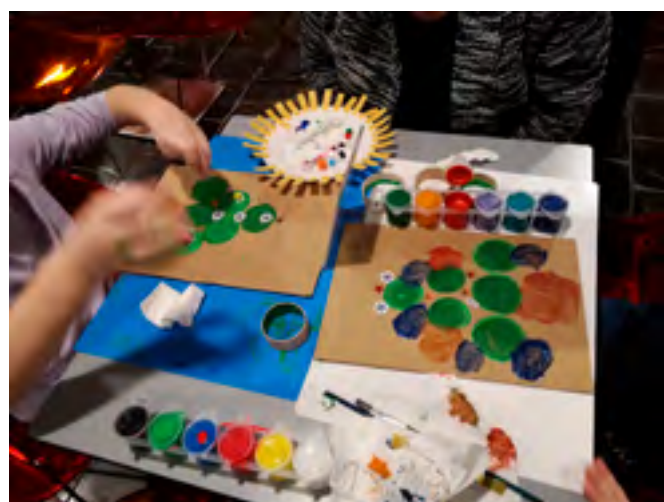
Dílna Možná přijde i čert

Po skončení produkce si mohli návštěvníci s členy kapely sdělit a vyměnit své hudební zážitky, během předvánočního setkání v Klubu G4. V rámci oslav 40 let od založení Galerie 4.