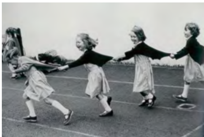
V pohybu, Markéta Luskačová, Girls in the playground IV, 1988