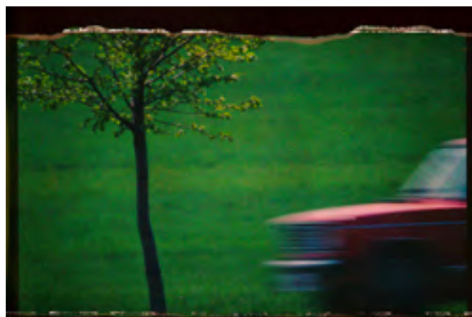
Město, Rudolf Jung, Krajiny pro Polaroid, 1993