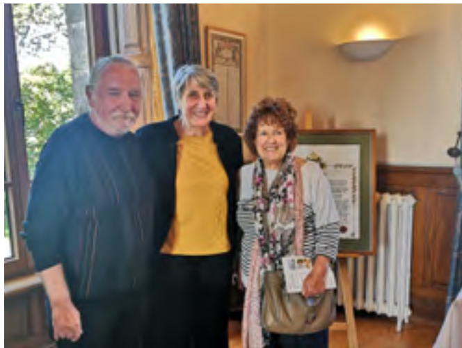
Setkání na radnici města Quimperlé, z workshopu Bretaň 2025.