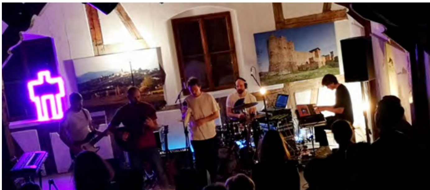
40 let G4, Koncert Zrní