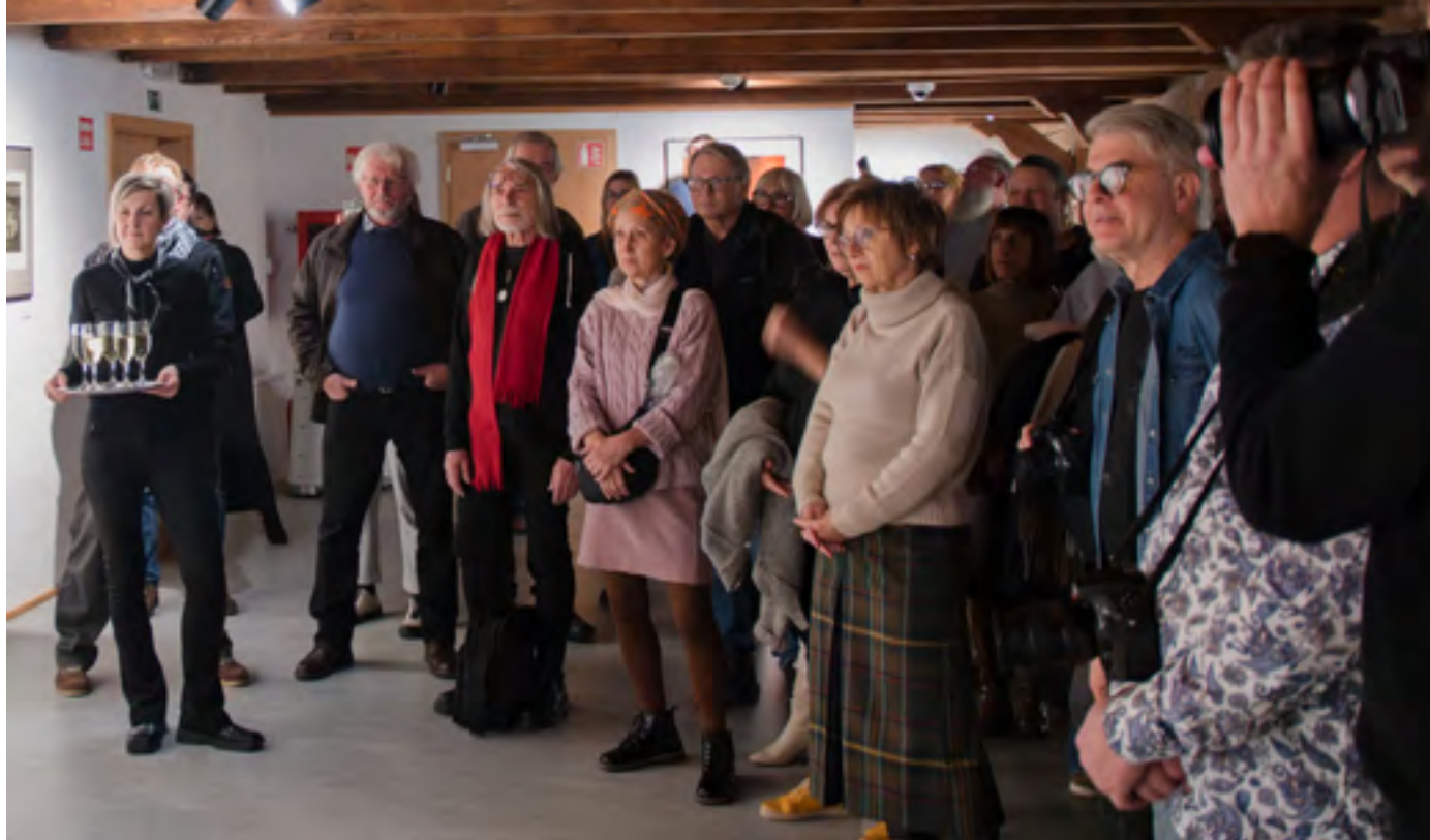
40 LET G4, Vernisáž