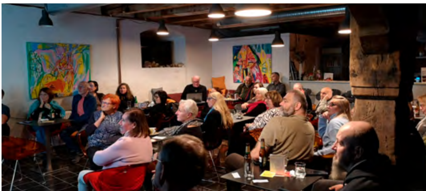
Michael Kocáb, komentovaná projekce, přednáška Tajemná zákoutí III