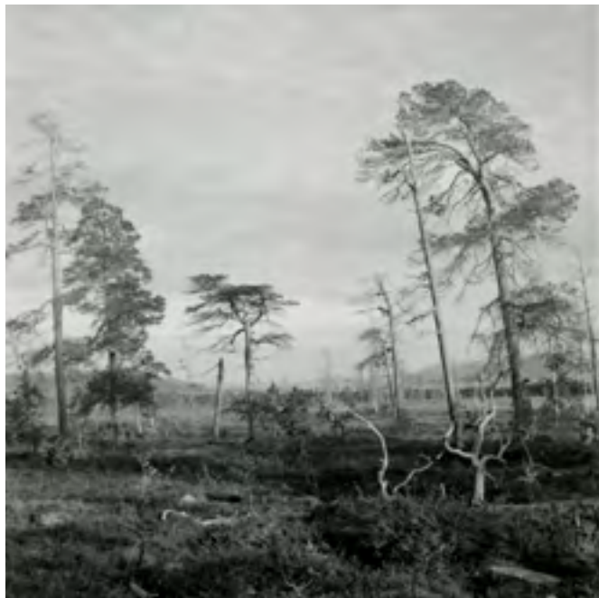
Dědictví obrazu, Tomáš Rasl, Rogen, 2021

První snímky jsou ještě víceméně dětské, ale i v nich už nacházím snahu o vystižení atmosféry a někdy i absurdity dění.